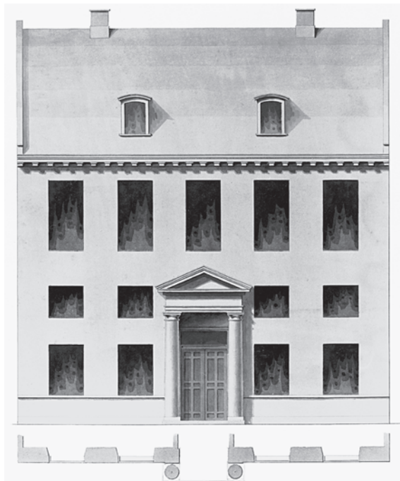
Fig. 5. Frimurerlogen i København, Kronprinsensgade 7, som den så ud med to søjler ved indgangen, da den var færdigbygget i 1807. Tegning i Hendes Majestæt Dronningens Håndbibliotek.

The old lodge in Copenhagen, built in 1807, where the meetings of the commission took place. Drawing in The Library of Her Majesty the Queen.